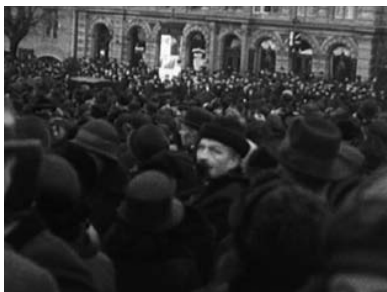
En man, sannolikt på Norra Bantorget, har just gjorts uppmärksam på kameran av kvinnan bredvid i folkhavet.

I bild är vi nu två minuter och åtta sekunder in i filmen, när tåget syns på långt avstånd, från den lilla människans horisont i folkhavet. Det stora utrymmet talar för att det är Norra Bantorget, i sin östra del ”en kompakt människomassa om ända till sex- och sjudubbla led, tåligt bidande halv 3-slaget”. 51 Kameran är på nytt placerad över folksamlingarna, men perspektivet är nu mer påträngande. Vi ser hur filmaren på typiskt manér fångar de närmast ståendes intresse. En kvinna längst fram i bild stirrar nyfiket, och det ser ut som en annan kvinna ett par rader längre fram, som verkar upptäcka kameran i ögonvrån, berättar för mannen bredvid, som därpå vänder sig om och tittar. Fascinationen inför filmmediet hos de filmade, som i fabriksfilmer från seklets början skapade av företaget Mitchell and Kenyon, bildar några ögonblicks brott i berättelsens flöde, när uppmärksamheten vänds tillbaka mot kameran: ”Det här är en film, det här är något stort”, kanske vi tänker. 52 Svenska Dagbladet rapporterar: