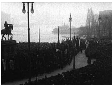
Gustaf Adolfs Torg.

som om han lite otåligt försökte distansera sig till den storslagna händelsen. 71 Utanför bilden är det dags för massorna – totalt ska man bli åtminstone 15 000 – att haka i processionen, allt enligt det förhandsbestämda schemat. Under det att tåget går över Norrbro bildar fanorna hedersvakt – ett mönster som ska upprepas även på senare socialdemokratiska partiledarbegravningar – och då de sedan anslutit till tåget har fanborgern nått upp till de cirka 250. 72