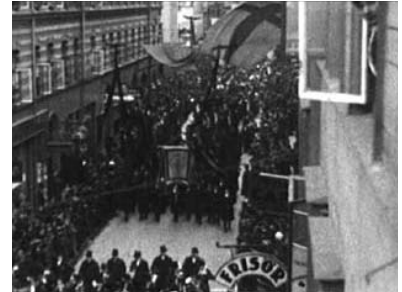
Drottninggatan, smyckad med flaggor och sorgdukar, och med publik i varje fönster.

Efter fanborgen följer så kistan, kransbärarna och kransarna, uppåt hundra till antalet och först och främst med röda band, vilka, enligt Svenska Dagbladet , förs fram ”av präktiga arbetartyper i hög hatt och vit halsduk”, även om man också märker ”en och annan kvinna med i flocken”. 57 Efter nästa klipp har filmarens position ändrats, så att kortegen rör sig bort från kameran istället för fram emot den. Härigenom rycks publiken med, och kan följa med tåget bort ur bild, mot nästa mål.