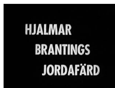
Titelsida till Hjalmar Brantings jordafärd .

"Hjalmar Brantings Jordafärd" förvarades till en början på Arbetarrörelsens Arkiv och Bibliotek i Stockholm, utan några som helst uppgifter om dess ursprung. Filmen är inte signerad, och den saknar eftertexter. Jag har heller inte funnit några belägg för att den skulle vara ett beställningsarbete från det Socialdemokratiska partiet. 9 I mitten av 1920-talet hade insikten om att filmen var ett viktigt vapen i den politiska agitationen nätt och jämt vaknat inom arbetarrörelsen. 10 Det är först på 1930-talet som man mer aktivt och