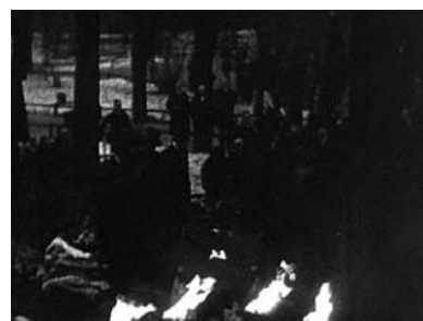
Adolf Fredriks kyrkogård, kistan sänks ner i graven.

I skenet av de fladdrande blossen paradera, defilera, hylla och hälsa massorna. Huvudena blottas åter, och ansiktena vändas mot mullhögen, där den vördades stoft vilar. Det är en sista blick, och den talar enkelt och sant om vad för känslor som bäras i alla dessas hjärtan – åldriga kvinnor och män, ynglingar och flickor. Det ligger en monumental vördnadsbetygelse i dessa ansikten, som ge denna sista blick. Och under tiden kolonn efter kolonn defilerar sågas minnesorden vid griften. 80