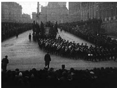
Processionen på Slottsbacken på väg bort från Storkyrkan. En man i publiken röker demonstrativt och vänder sig mot kameran.