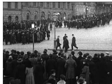
Kolonnerna ställer upp på Slottsbacken.

Nästa scen kommer sju minuter och trettiosex sekunder fram i filmen. Planenligt paraderar processionen nu med riktning bort från kyrkan, nerför Slottsbacken, som är kantad av kolonnernas människomassor. Klockan har blivit ungefär halv fem. I täten går orkestern, så fanborgen, kistan, kransbärarna, och sedan tåget av anhöriga och kyrkobesökare. Vinden tar tag i fanorna och nu ser vi tydligt hästarnas svarta schabrack. Mitt i människohavet står en man och röker,