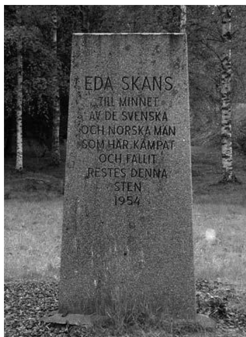
Minnesstenen från 1954 var en av de medieformer som rumsligen kommunicerade skansens olika betydelser.

Vid parkeringsplatsen framför skansen är ytterligare en minnessten rest. Den är av ett senare datum och den mörka texten är enkel: "Eda skans till minnet av de svenska och norska män som här kämpat och fallit restes denna sten 1954". 36 Mellan minnesstenen från 1814 och denna sten har en union både ingåtts och fredligen upplösts, två världskrig har ägt rum och under 1950-talet var Norge och Sverige i färd med att bygga en identitet som norra Europas välfärdsdemokratier. 37 De forna stridigheterna blev i detta sammanhang möjliga att lyfta fram och erkänna. Detta grundade sig inte minst på samarbetet under andra världskriget, som sedan dess har problematiseras, men