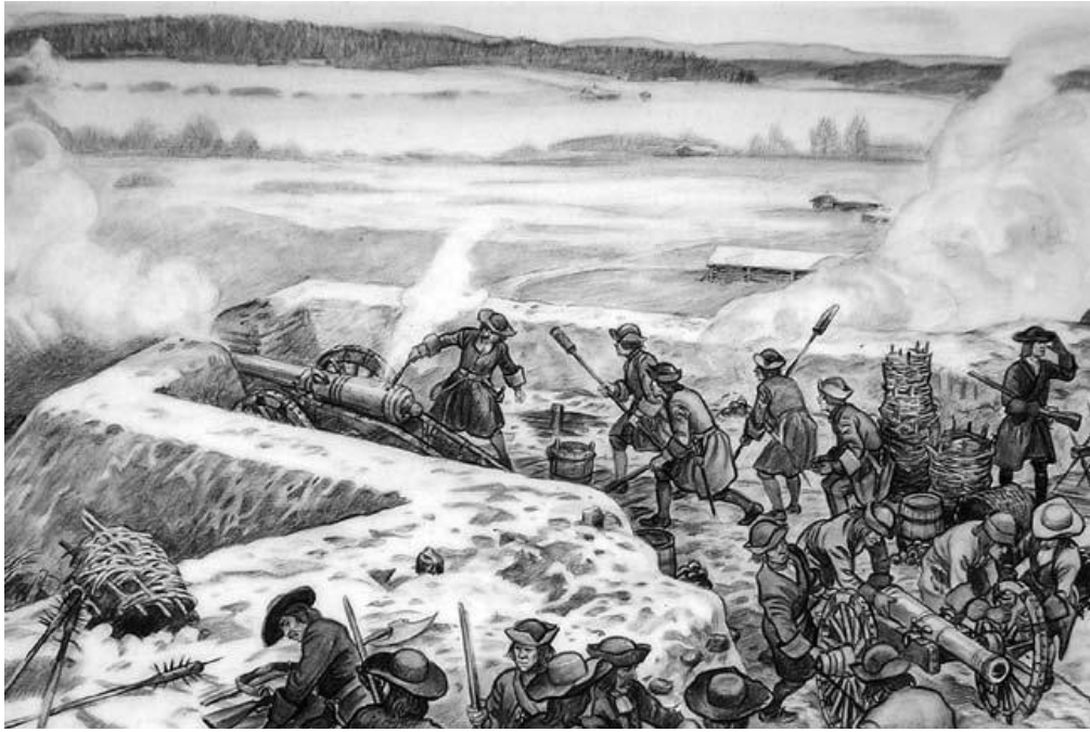
Bataljframställningen berättar om den krigiska historia som utspelat sig i de norsk-svenska gränsområdena.

som på 1950-talet var en del av den officiella svensk-norska politiska kulturen. 38