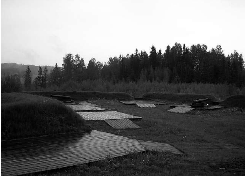
Kanonernas utplacering markerar eldställningarna. Deras närvaro medierar tillsammans med bataljframställningen de ofredsår som hör till det förflutna.

kan var ständigt återkommande, inte minst i Sverige. 39 Skyltarna minde ännu en gång om det krigiska förflutna som de norska och svenska samhällena lämnade bakom sig i takt med att välfärdsdemokratierna växte fram, för Norges del framför allt efter andra världskriget.