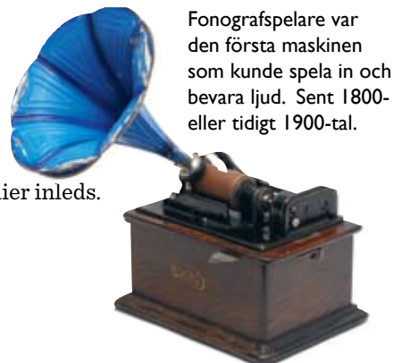
Fonografspelare var den första maskinen som kunde spela in och bevara ljud. Sent 1800- eller tidigt 1900-tal.

2009 KB och Statens ljud- och bildarkiv går samman och blir en myndighet.