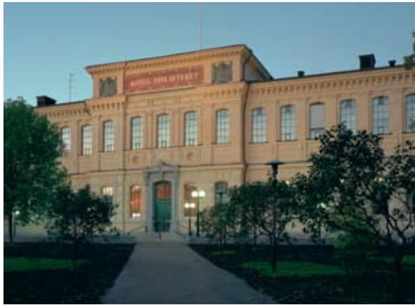
August Strindberg arbetade som extra ordinarie amanuens på KB mellan 1874 och 1882. Biblioteksbyggnaden i Humlegården uppfördes 1871-1878.