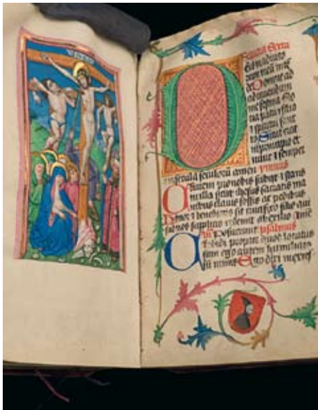
Siebenhirters bönbok, 1470-talet. Brandskadad i slottsbranden 1697.

1661 En lag stiftas om pliktleverans som gör boktryckare skyldiga att leverera minst ett exemplar av varje skrift till KB innan den sprids.