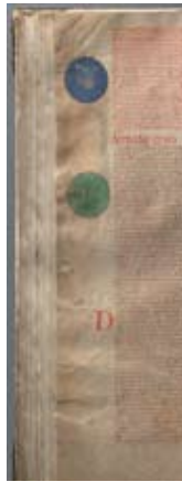
Djävulsbibeln med sitt ovanliga porträtt av djävulen.