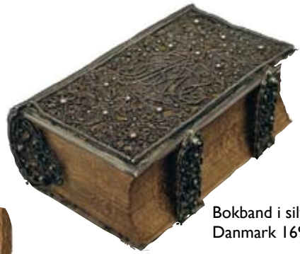
Bokband i silver, Danmark 1690-tal.