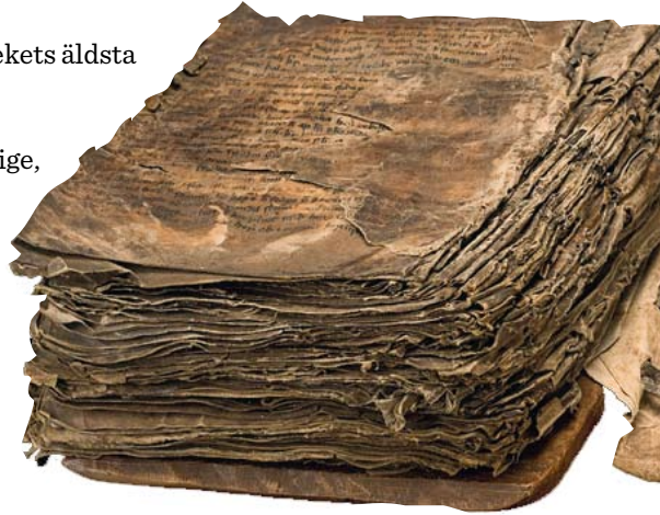
Amicus saga ok Amilius m. fl. Isländsk handskrift, 1400-talet.

1649 Djävulsbibeln (Codex gigas eller Jätteboken) kommer till det kungliga biblioteket som en del av krigsbytet från trettioåriga kriget.