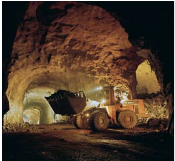
KB:s nya magasin finns 40 meter under Humlegården och byggdes i början av 1990-talet.

I början av 1990-talet inleddes en genom- gripande förändring av KB:s magasin och öviga lokaler. På försommaren 1997 invigdes två stora bergrum som färdigstälts under Humlegården. Bergrummen inrymmer två femvåningshus med ett sammanlagt lagrings- utrymme på 16 hyllmil. Där finns i dag huvud- delen av KB:s fysiska material.