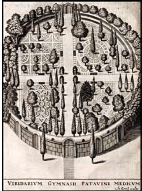
The plan of the botanical garden at Padua. J.P.H. Tomasini, Gymnasium patavinum (Undine, 1654).

for a hard disc with sufficient memory or a cloud, one turned to a garden – structured information repositories, more comprehensive, more long-term and lasting, but also more cumbersome.