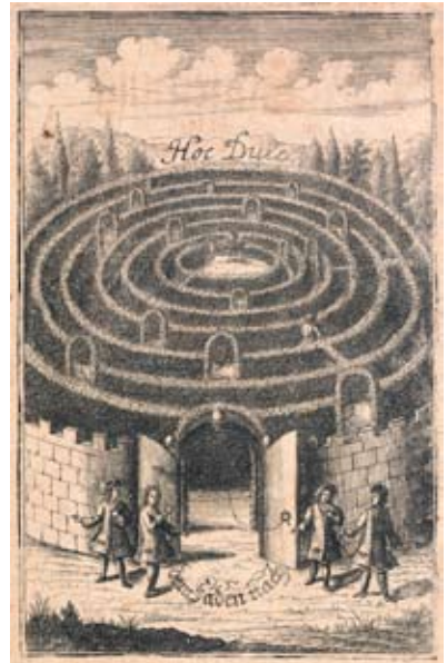
The search for knowledge as depicted in J.F. Reimman's Versuch einer Einleitung in die Historiam Literariam , vol. 1 (Halle, 1723).

Today, we are of the firm conviction that the written and printed work is more permanent than the spoken. At the same time, we know that it is nowhere as elastic as the spoken word. With the rise and spread of written culture, the world was split into two separate realities. There were communities which searched for knowledge and expressed their identity in written form, others which did not need text to attain knowledge and reaffirm identity.