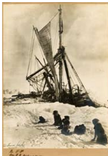
Endurance som sakta krossas sönder av isen.

I november, fyra veckor efter det att man lämnat skeppet, sjunker Endurance . Även om man förutsett detta blir det ändå en mycket påtaglig påminnelse om gruppens desperata situation. Nu gäller det att bekämpa den växande känslan av meningslöshet. Man gör förnyade försök att förflytta sig men med samma resultat som tidigare. Dessutom driver isen i fel riktning.