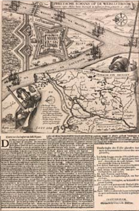
Copperplate engraving of Danzig (Gdansk) Sweetsche Schans op de Weiselsroom (Amsterdam, 1626).

Parallel to the compartmentalization and division for mnemonic purposes there arose the urgency to package information in a new and creative way. Communication was no longer reinforced by repetition and agglomeration, without significant ruptures of continuity, as in the oral mode. On the contrary, memory was purposefully configured to be short term and packaged in small units.